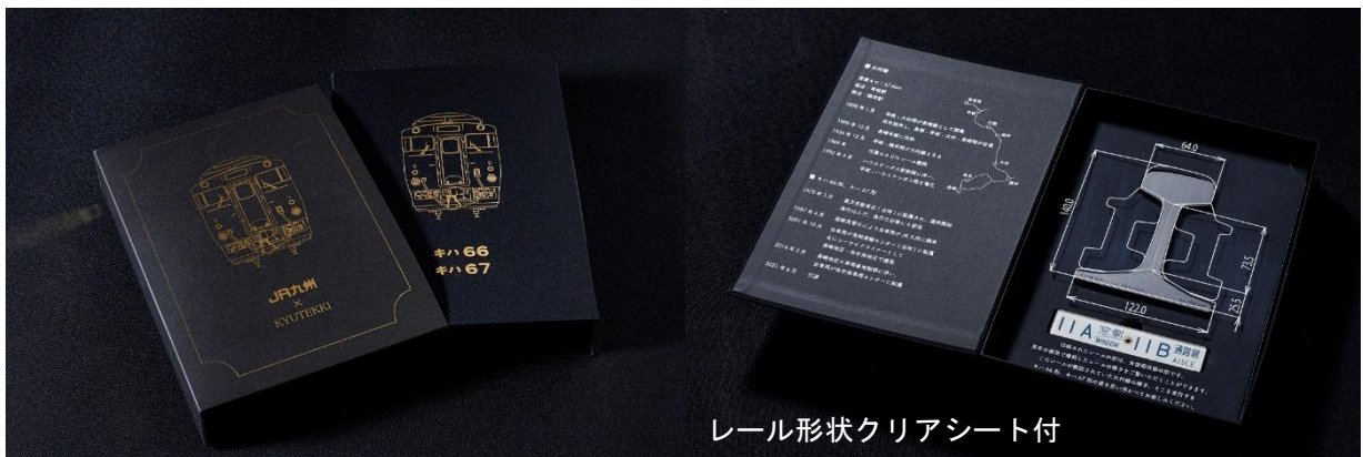
レール形状クリアシート付